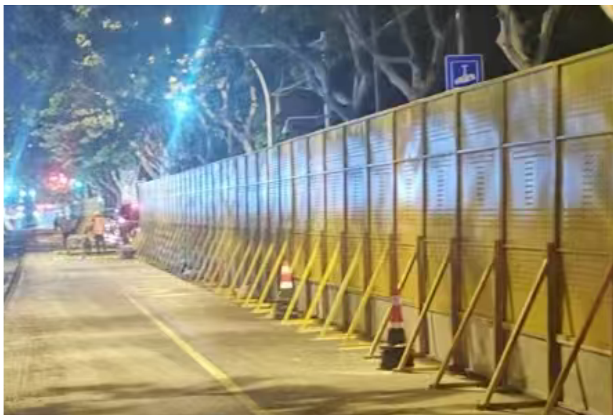
图一 装配式彩钢板围挡（正面、背面）